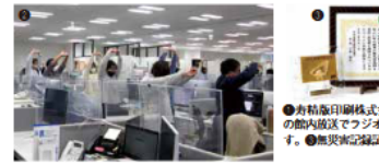
●寿精版印刷株式会社●就業時の社内放送でラジオ体操が流れます。●無実認定証

メンタルヘルスのアフターケアとして産業医制度の100%実施のほか、心理的安全性教育を実施し、指先安全システムというかつPDC(Aサイクルが回っている)改善しています。社外においては、採用活動で応募者から「健康経営」に関する質問をいただいたり、近隣企業からインタビューを受けるなど、高い関心を向けられているという手応えを感じています。 「これからの課題を教えてください」 引き続き、従業員満足度調査結果を社内報で告知して、全社活動を「働きやすさ」職場作り」に取り組んでいきます。また、